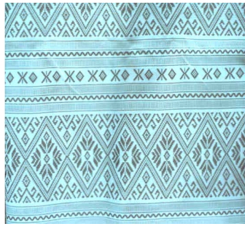
รูปที่ ๓ ตัวอย่างผ้าแพรวาล่อง (ข้อ ๒.๓)