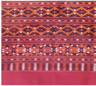
รูปที่ ๒ ตัวอย่างผ้าแพรวาเกาะ (ข้อ ๒.๒)