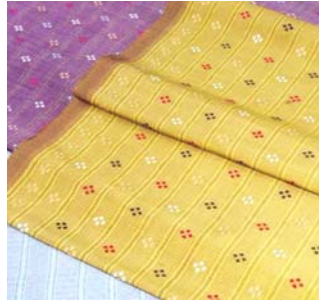
รูปที่ ๒ ตัวอย่างผ้ากาบบัว (จก) (ข้อ ๒.๒)